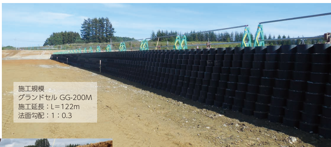
施工規模 グラウンドセル GG-200M 施工延長：L=122m 法面勾配：1：0.3