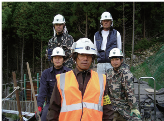
株式会社風戸工務店の皆様

最後に、施工に携わっていただいた、株式会社風戸工務店の皆様の丁寧な施工により、見事な完成体を見せて頂いたことを、深く感謝を申し上げます。