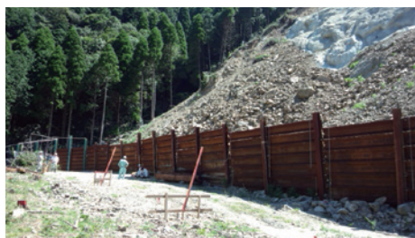
◀ 施工前状況 ▼ 施工状況