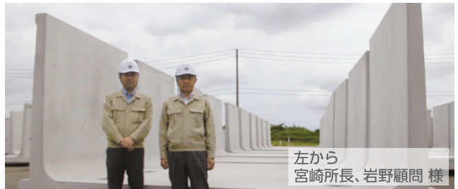
左から 宮崎所長、岩野顧問 様