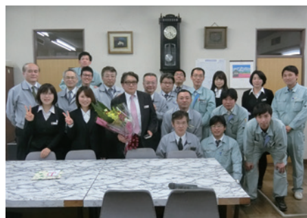
河上金物株式会社の皆様

今回は国土交通省での物件となりましたが、県・市町村でも採用していただける様、元請け業者へ PR を行なっていきたいと思っております。最後に、今回の施工に携わっていただいた施工業者様、設計コンサル様、関係者の方々のご尽力に感謝申し上げます。