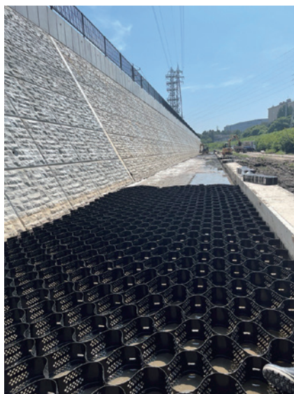
グランドセル展開

このように、グランドセルは砕石を拘束し、地盤の補強材として有効に使用することができます。この他にも林道における轍掘れ対策や、駐車場、工事用道路などへの適用も可能となるので、これからも様々な現場への課題解決に努めていきたいと思っております。