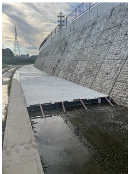
コンクリート打設後