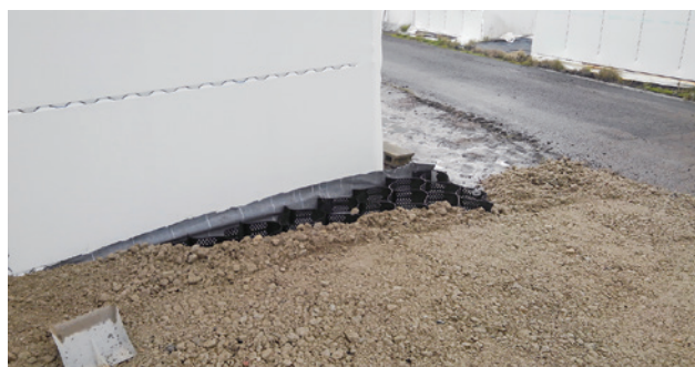
2 格納庫ハウス外側の様子です。ハウスの際も丁寧に仕上げます。