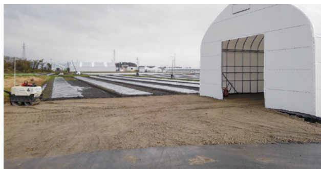
4 格納庫ハウス内・外で 160 平方メートルの工事を作業員 4 名で実質 1 日で完成しました。