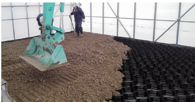
3 格納庫ハウス内部の様子です。グランドセルを敷き、碎石を充填、転圧します。