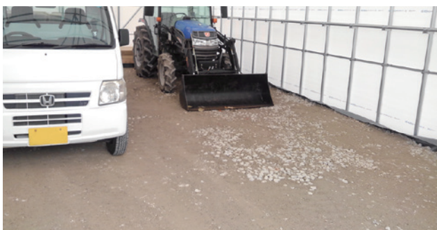
5 グランドセルにより安定した路盤が構築され車両の輪荷重を分散します。